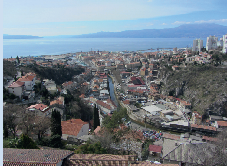
Rijeka von der Burg Trsat